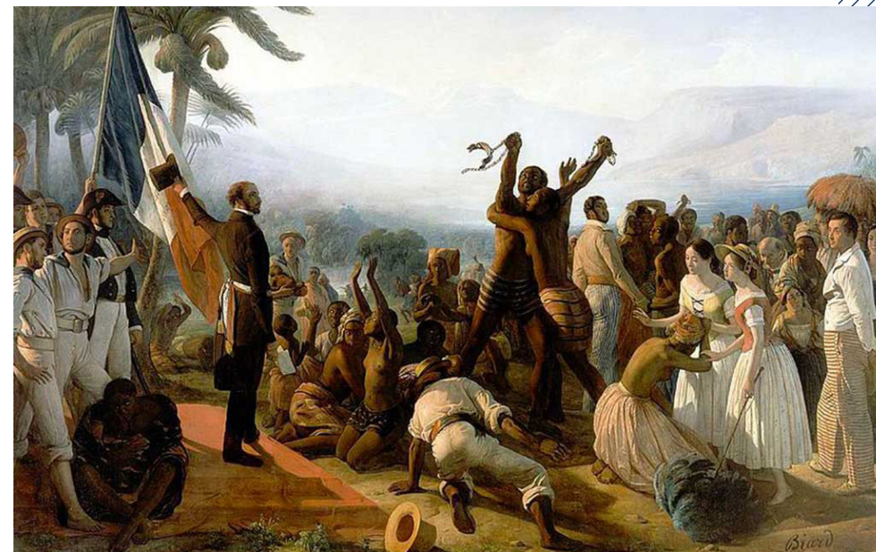
Abolition de l'esclavage le 20 décembre 1848 prononcée par le commissaire Sarda Garriga.

Le statut de département français d'outre-mer , donne à La Réunion et à Mayotte une identité particulière d'îles françaises de l'océan Indien , intégrées à l'Europe .