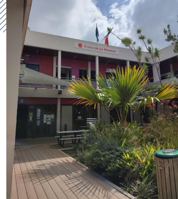
Entrée sud du restaurant universitaire

■ Pour les repas du soir , des menus seront commandés et livrés à partir de 18h30 au niveau de votre logement à la résidence, éventuellement dans une salle commune prévue pour vos pauses repas et vos moments de partage en groupe.