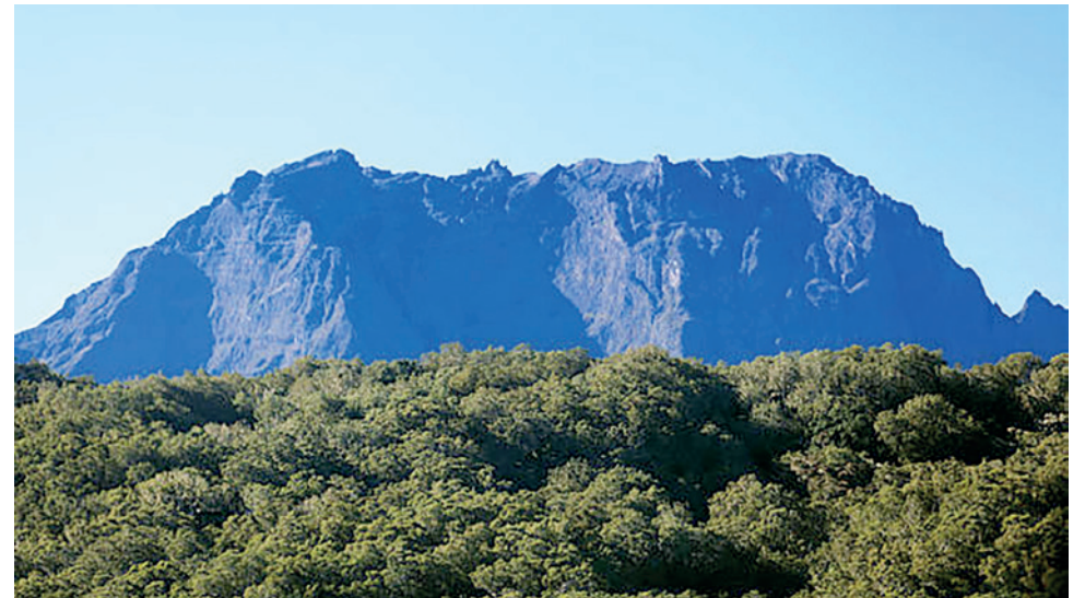
Vue sur le Piton des Neiges, plus haut sommet de l'île à 3071 m d'altitude.

La population réunionnaise actuelle est d'environ 854 450 habitants (source INSEE 2021).