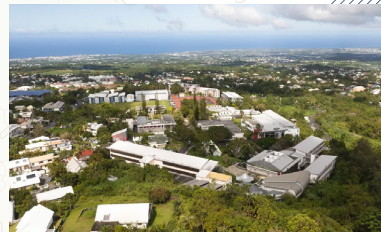
Le campus universitaire du Tampon vu du ciel.

Elle occupe une place unique : il s'agit de la seule université française de l'Indiacéanie. Ce positionnement au cœur de l'axe Afrique-Asie lui confère un rôle majeur d'ambadrice de l'enseignement supérieur de la recherche et de l'innovation française dans la zone. Sur l'île, l'Université est implantée sur 7 sites (au nord, à l'ouest et au sud).